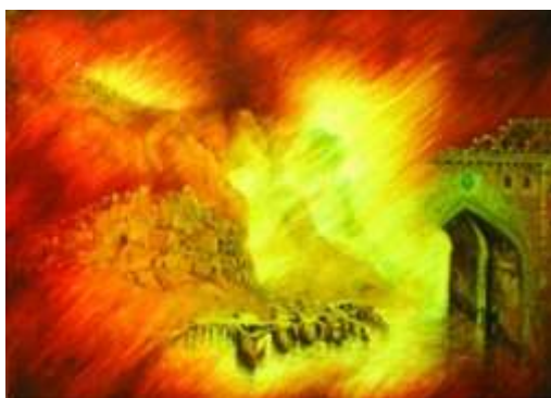
تصویر ۲. دزفول در آتش، اثر سید نظام‌الدین امامی فر؛ تکنیک: رنگ و روغن؛ ابعاد: ۱۲۰×۱۰۰، ۱۳۶۶ (آرشیو هنرمند)