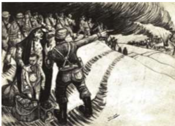
تصویر ۵. دفاع اثر سیروس مقدم؛ تکنیک: نقاشی خط؛ ابعاد: ۲۰*۱۵ سانتیمتر، ۱۳۶۰

تصویر شماره ۵ اثر سیروس مقدم: «دفاع» نام یکی از آثار سیروس مقدم است که در سال ۱۳۶۰ خلق شد و روایتی از صحنه نبرد و دفاع رزمندگان ایرانی را نشان می‌دهد. تصویر کلی اثر، هنر مقاومت در برابر تجاوز را تداعی کرده که در کنار صحنه‌های تلخ ترک کردن شهر توسط کودکان و زنان، سربازان متعهد میهن را نشان می‌دهد که برای دفاع از زادگاه خود به داخل شهر روانه می‌شوند و با همان شدت و همبستگی دوران انقلاب در جهت حفظ باورهای مردمی و زنده نگه داشتن اصول ارزشی گام برمی‌دارند. این باورها و ارزش‌ها را در این اثر، نقاش به درستی در جهت حفظ تعهد هنری خود به میهن و زادگاهش نشان داده است. حضور نیروهای مردمی، نظامی و خودجوش در قسمت بالای سمت چپ تصویر که حرکتی رو به جلو دارند، در کنار حضور زن و فرزند و سربازی که با حرکت دست خود نگاه زن را به سمت حادثه رخ داده شده هدایت می‌کند که با جهت حرکت برعکس دود سیاه و نگاه کودک به خارج از کادر، تضادی موزون و هماهنگ با موضوع را پیش روی مخاطب قرار می‌دهد؛ در نهایت، مخاطب را به بررسی تمامی محتوای کار فرا می‌خواند. تصویر در حالت اکسپرسیون شدید در طراحی و نوع استفاده از خطوط اجرا شده که تلاش هنرمند را در نشان دادن محتوا و موضوع در جهت رسیدن به هویت ملی و مردمی که نسبت به فرم و دیگر عناصر در اولویت قرار می‌گیرند، به تصویر می‌کشد.