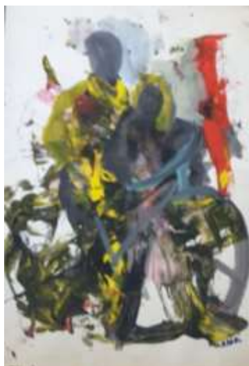
تصویر ۳. مهاجرت اثر محمدهاشم بدری؛ تکنیک: رنگ روغن، ابعاد: ۳۵×۲۵، ۱۳۶۰ (آرشو هنرمند)