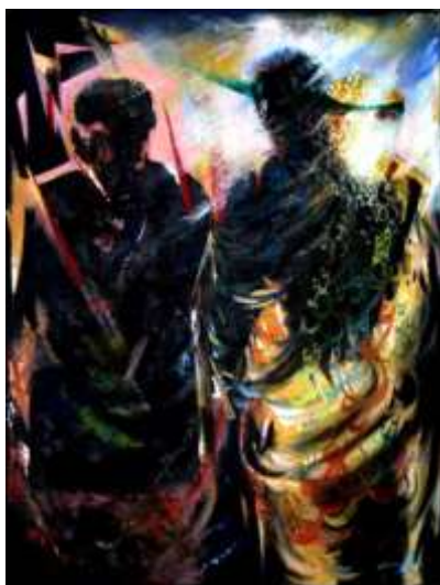
تصویر ۴. وداع، اثر عبدالرضا رابطی؛ تکنیک: اکریلیک؛ ابعاد: ۱۳۰×۹۰، سال‌های آخر جنگ تحمیلی (آرشو هنرمند)

سمت راست دیده می‌شوند، به هیجان تابلو افزوده است. در ساختار خلق این اثر، شاهد ورود عواطف و احساسات هنرمند به‌عنوان عصارهٔ تکمیل‌کنندهٔ اثر در نمایش نمادهای ارزشی و آرمانی بوده که جزو ملاک‌های ارزش‌گذاری در هنر دفاع مقدس و بیانگر تمایل جدی هنرمند به امور ارزشی و تعهد هنری پیرامونش است. استفاده از خطوط پر انرژی و محکم به‌همراه رنگ‌های تند اثری تکان‌دهنده را می‌آفریند که این عناصر در ارتباط با هم ترکیب‌بندی فعال و خاص اثر را به‌همراه داشته و کیفیت و قدرت تأثیرگذاری آن را تعیین می‌کند. فضای کلی اثر گذشته از حالت غم‌انگیز و تاریک‌بودن آن، به دلیل رنگ‌های منتخب آن‌هم با نور روشن و سفیدی که از پشت سر آن‌ها در حال تابیدن است، رنگ‌مایهٔ عرفانی به خود گرفته و تضاد رنگی قدرتمندی از تاریکی و روشنایی در مواجهه با واژهٔ عشق که به‌صورت بافت روی لباس سرباز تکرار شده را نمایان می‌سازد. باتوجه به تنوع در کاربرد خطوط و هماهنگی بین اجزای تشکیل‌دهندهٔ تصویر، وحدت در کثرت، تنوع اندازه، تناسبات، کیفیت و جهت آن‌ها، جذابیت عاطفی و بصری چشم‌گیری در اثر تولید کرده است.