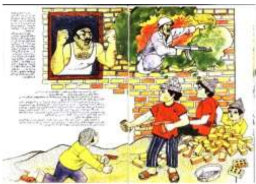
تصویر ۱. جنگ یا صلح اثر پرویز اقبالی؛ تکنیک: روان نویس، آبرنگ، گواش؛ اندازه رحلی، ۱۳۶۲ (آرشیو جنگ حوزه هنری تهران)

معماری‌های قدیمی و ارزشی اشاره داشته و از نمونه نماد و نشانه‌های رایج در هنر متعهد پس از انقلاب، در زنده نگه داشتن ارزش‌های آرمانی و اسلامی مردمان سرزمین ایران است. فضای کار، واقع‌گرایی دوران جنگ را نشان می‌دهد که با استفاده از معنا و نمادهایی همچون مسجد، اماکن قدیمی و مذهبی، حقایق و مفاهیم بی‌شماری را به صورت نماد و نشانه‌های رایج در هنر متعهد به نمایش درآورده است. استفاده از رنگ قرمز، سبز و زرد در این نقاشی هر کدام نمادی از باورهای مردمی است که نقاش به بهترین شکل ممکن آن را نشان داده است. رنگ قرمز که نشان از قیامت، خون شهیدان و گل لاله، در کنار رنگ زرد که نمادی از خورشید و زندگی شهدا در بهشت همراه با رنگ زرد که به امید رویش دوباره، فناپذیری، رستاخیز و محشر است، به زیبایی معنایی و مفهومی اثر افزوده و در نهایت تصویری چشم‌نواز را نشان می‌دهد.