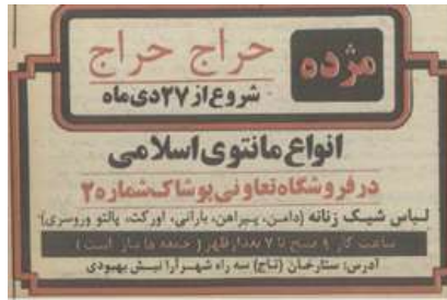
تصویر شماره ۲: غیاب تصویر در آگهی تبلیغاتی پوشاک مجله اطلاعات بانوان بعد از انقلاب

آن گفتمان تلاش می‌کرد تا نقش زن را از یک ابزار جنسیتی به اعتلای کرامت انسانی که ریشه در ارزش‌های اسلامی دارد، ارتقا دهد. از این رو، در برساخت هویت زنان ضمن محوریت قرار دادن کلیشه‌های خانه‌داری و خانواده‌داری، کدبانوگری و مادری نقش زنان در خانواده، بر کانونی بودن مسئولیت آنان در اقتصاد خانواده، مبتنی بر خودکفایی تأکید می‌شود. بدین گونه، گفتمان انقلاب اسلامی در راستای برساخت هویتی زنان، افزون بر کلیشه‌های جنسیتی و دال مرکزی حجاب به بازنمایی نقش آنان در مشارکت اقتصاد خانواده می‌پردازد. با توجه به ایدئولوژی پس‌انقلابی در این دوره، غیاب تصاویر، به عنوان ابزار دیگر نشانه‌شناختی در آگهی‌های تبلیغاتی مجلات خانوادگی به وفور مشاهده می‌شود. به گونه‌ای که از زمان انتشار مجله زن روز و اطلاعات بانوان از ابتدای انقلاب تا پایان دفاع مقدس هیچ‌گونه آگهی تبلیغاتی همراه با تصویر در این گونه نشریات به چشم نمی‌خورد. ایدئولوژی حاکم بر گفتمان انقلاب اسلامی که سردبیران این دو مجله آن را بازنمایی می‌کنند، حذف تصاویر از آگهی‌های تبلیغاتی در راستای اهداف ساده زیستی و شیوه زندگی اسلامی نمودی از مؤلفه‌های هویتی زندگی اسلامی و انقلابی بوده است (تصویر شماره ۳ و ۴).