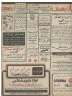
تصویر شماره ۱: آگهی‌های تبلیغاتی مجله اطلاعات بانوان

این متن که نگرش متصدیان نشریه در قبال آگهی‌های تبلیغاتی است تا آخرین شماره مجله اطلاعات بانوان در صفحه اختصاصی آگهی تبلیغاتی به چاپ می‌رسید. از این رو، هر دو نشریه یک صفحه جداگانه به آگهی‌های تبلیغاتی اختصاص داده بودند. مجله زن روز در صفحه بازارچه و مجله اطلاعات بانوان در صفحه بازار هفتگی تبلیغات خود را منتشر می‌کردند.