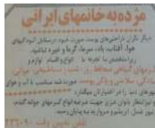
تصویر شماره ۳ و ۴: غیاب تصویر در آگهی تبلیغاتی مجله اطلاعات بانوان و زن روز بعد از انقلاب