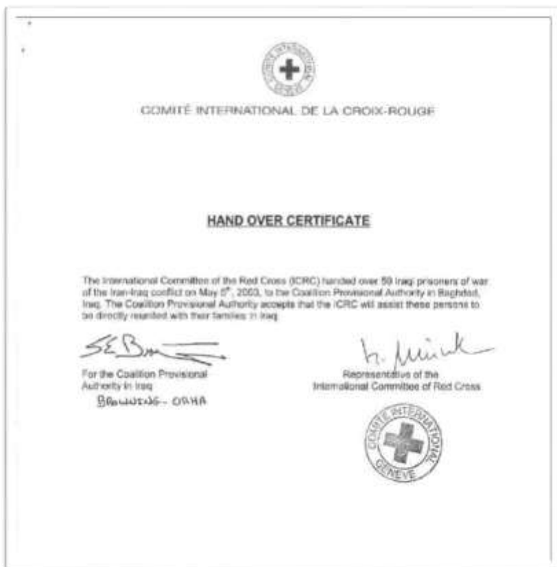
شکل شماره ۶: سند ۱۷۷ صورتجلسه تحویل اسرای عراقی