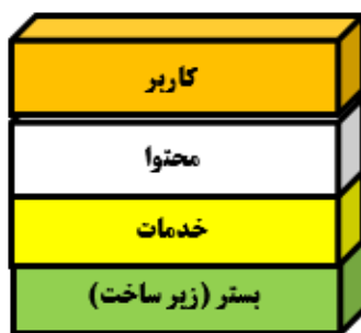
شکل (۲): مدل چهار لایه ای فضای سایبر (مرکز ملی فضای مجازی، ۱۳۹۶)

۲۲۴). طی سالهای اخیر، تعاریف زیادی برای این واژه در اسناد راهبردی کشورها ارائه و به مرور تکمیل شده است. به طور کلی فضای سایبر عبارت است از «فضایی، برآمده از شبکه های وابسته به یکدیگر، اعم از زیرساخت های فناوری اطلاعات، شبکه های ارتباطی، سامانه های رایانه ای، پردازنده های جاگذاری شده، کنترل کننده های صنایع حیاتی، محیط تولید، پردازش، ذخیره سازی، ارسال، دریافت، امحاء، بازیابی و بهره برداری از اطلاعات می باشد» (تقی پور، ۱۳۹۸: ۲۹). از سوی دیگر فضای سایبر، تعاملات و اثر متقابل این محیط و انسان را نیز در بر می گیرد. شورای عالی فضای مجازی به منظور ترسیم این فضا، یک مدل چهار لایه ای برای فضای سایبری کشور به شرح شکل (۲) ارائه نموده است.