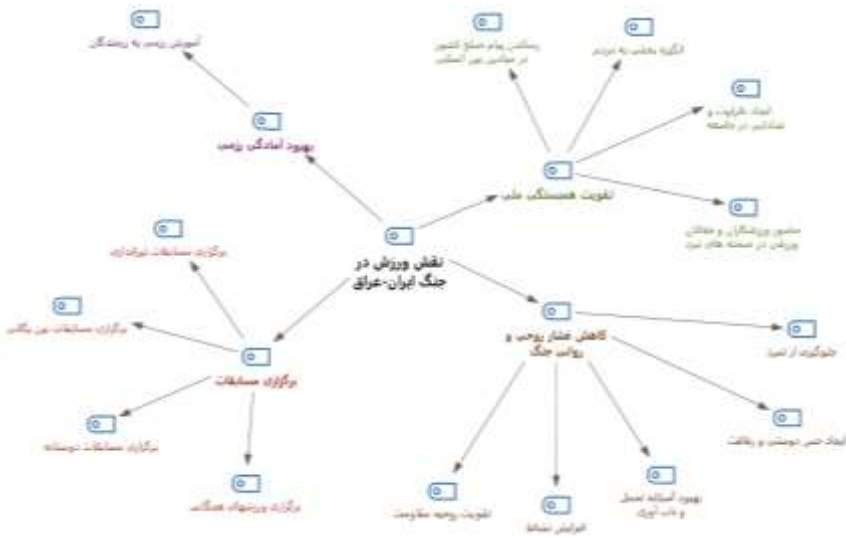
نمودار نقش ورزش در جنگ تحمیلی رژیم بعث عراق علیه ایران