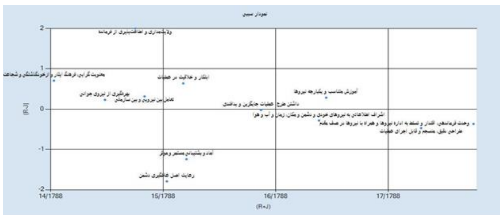
شکل ۲- نمودار سینی عوامل کلیدی موفقیت