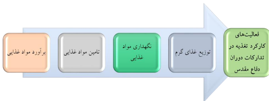
شکل ۳- فعالیت‌های کارکرد تغذیه در تدارکات دوران دفاع مقدس

سازمان سپاه در طول دوران دفاع مقدس به‌عنوان یک سازمان حرفه‌ای در جنگ نبوده بلکه به‌صورت بسیج مردمی مأموریت‌های خود را انجام می‌داد. بحث تغذیه در این سازمان یک موضوع اساسی بود. به عبارتی سازمان سپاه مردمی بوده و مردمی می‌جنگید. بنابراین روحیه، اخلاق و رفتار مردمی در سازمان جاری بود و تغذیه آن متناسب با ذائقه بسیج مردمی بود، یعنی با کم کردن فاصله بین آشپزخانه و خط مقدم برای یگان‌های عملیاتی غذای گرم تهیه می‌شد. لذا موضوع تغذیه یک دانش نهفته و استراتژیک در مجموعه تدارکات سپاه است که این دانش روز به روز در حال پیشرفت و توسعه است. مأموریت بخش «تغذیه»، تأمین، نگهداری، توزیع و سرو غذا برای رزمندگان خط مقدم و پشت جبهه بود. یعنی هر نیرویی وارد منطقه می‌شد، مسئولیت تغذیه‌اش را این بخش بر عهده داشت. درواقع، اولین قسمت‌هایی که در تغذیه وجود داشت، توزیع و طبخ بود که خودبه‌خود و به‌صورت سنتی به وجود آمد. هر غذایی که تقسیم می‌شود باید طبخ و سرو شود. این دو، ارکان اصلی بودند و به‌مرور، معلوم شد که نیاز به تأمین، نگهداری، حمل‌ونقل، جذب نیروی انسانی و... وجود دارد ۲ . فعالیت‌های اصلی کارکرد تغذیه در شکل زیر نمایش داده شده است: