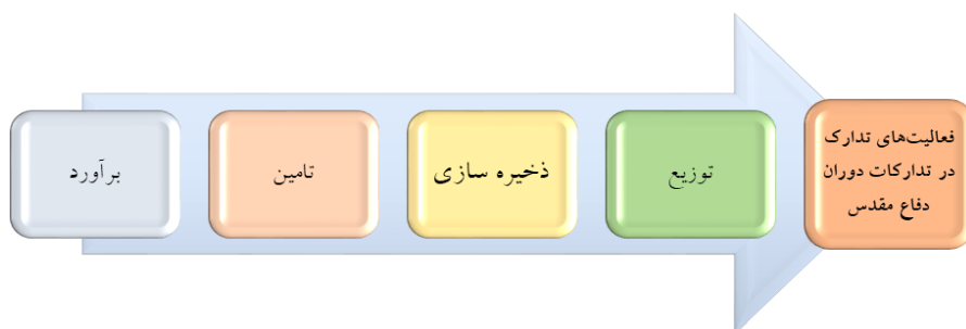
شکل ۲- فعالیت‌های تدارک در تدارکات دوران دفاع مقدس

خارج کشور، کالاهای موردنیاز تأمین می‌شود. این کالاها بر اساس برنامه‌ریزی صورت گرفته با توجه به اولویت‌بندی و سیاست‌های فرماندهی در اختیار واحدهای نظامی قرار می‌گیرند. بخش عمده‌ای از کالاهای موردنیاز یک سازمان نظامی در سلسله‌مراتب ساختاری در انبارها و آمادگاه‌ها ذخیره شده و طبق برنامه یا به‌طور اضطرار با توجه به نیاز هر یک از یگان‌ها و واحدهای نظامی واگذار می‌شود. تدارک در دوران دفاع مقدس برآورد، تأمین، توزیع، انبارداری و ارسال کالا و خدمات به یگان‌های عملیاتی را شامل می‌شد. در ابتدای جنگ تدارکات سپاه فاقد هرگونه امکانات و تجهیزات در این حوزه بوده و در طی زمان در حوزه تدارک تبدیل به مجموعه‌ای می‌شود که در کشور نظیری نداشته است. مراکز پشتیبانی با توانایی لازم در تهران، جنوب، غرب و شمال‌غرب کشور ایجاد می‌شود. مراکز نگهداری مهمات در کل کشور توسعه می‌یابد. سیستم‌های نظری تنظیم می‌گردد که اگر در تدارکات سپاه یکی از زیرسیستم‌ها از مدار خارج شود، بقیه زیرسیستم‌ها شکل عملیاتی خودشان را حفظ کرده و با ارتباطی که با همدیگر داشته‌اند به‌صورت هوشمند کار تدارک از یگان‌های عملیاتی به نحو احسن صورت گیرد ۱ . فعالیت‌های کارکرد تدارک در دوران دفاع مقدس در شکل زیر نشان داده شده است: